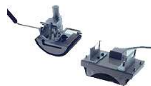
Table pour presse

(cadre métallique, support bois et tiroir)