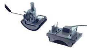
Table pour presse

(cadre métallique, support bois et tiroir)