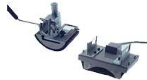
Table pour presse

(cadre métallique, support bois et tiroir)