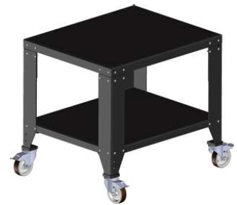
Table pour presse

(idéal pour fixer les marquages avant la pose)